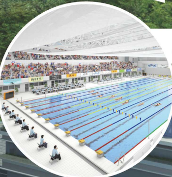
屋内競技用プール