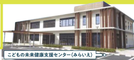
こどもの未来健康支援センター(みらいえ)