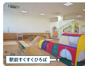
駅前すくすくひろば