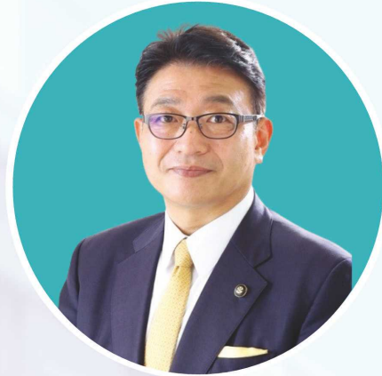
姫路市長 清元 秀泰