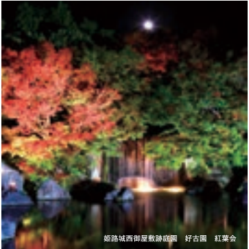
姫路城西御屋敷跡庭園 好古園 紅葉会