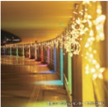
姫路市立文化センター