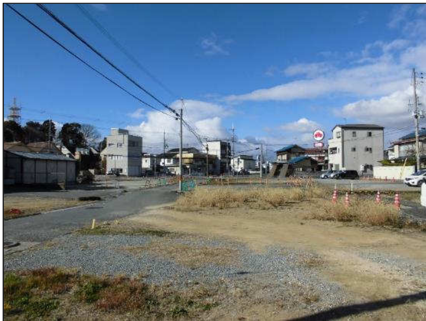
城北線(西工区) (東から西)整備中