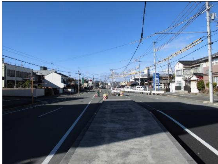
城北線(西工区) (東から西)整備中