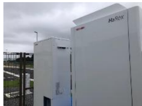
⑧純水素型の燃料電池コージェネレーション (熱電併給) システム (道の駅 なみえ)