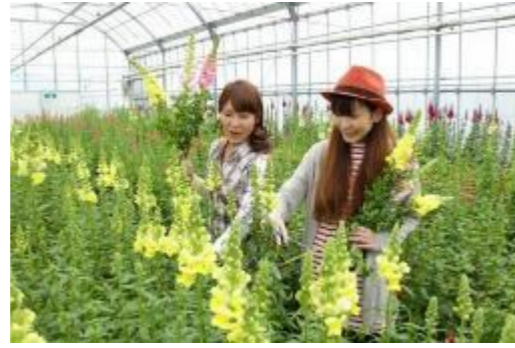
②花摘み園 (道の駅 おおつの里)