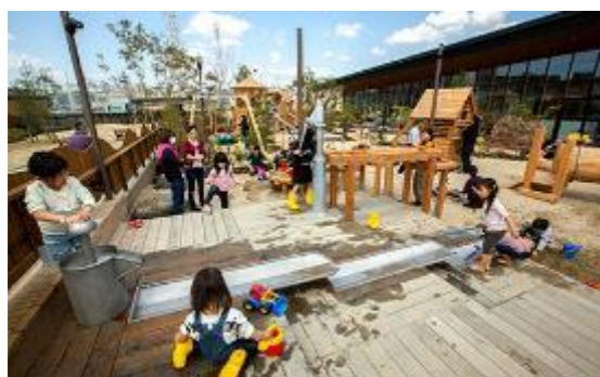
⑩ポーネランド・プレイヴィル (安満遺跡公園)