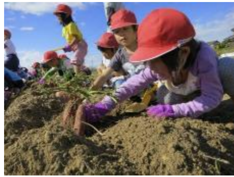
① 体験農園 (いもほり)