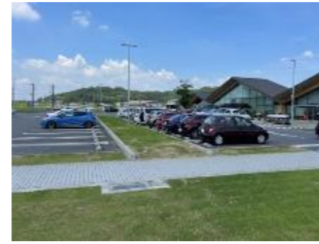
⑫緑の多い駐車場 (道の駅ましこ)