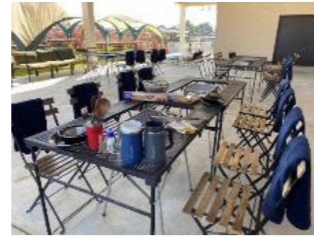
③手ぶら BBQ (道の駅 グランテラス筑西)