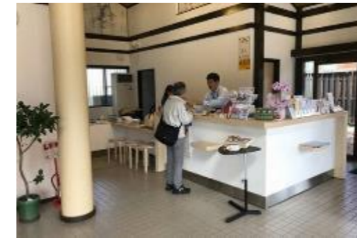
④コンシエルジュ (道の駅飛鳥)