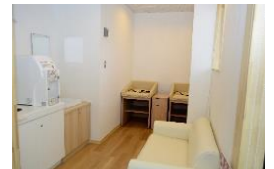
⑦ベビーコーナー (道の駅米沢)