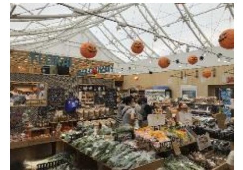
⑨地元特産品販売所 (道の駅神戸フルーツフラワーパーク)