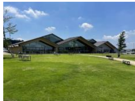
⑥芝生広場 (道の駅ましこ)