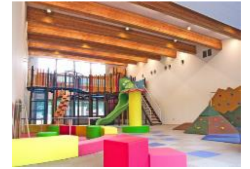
⑤屋内キッズコーナー (道の駅 ふたついで)