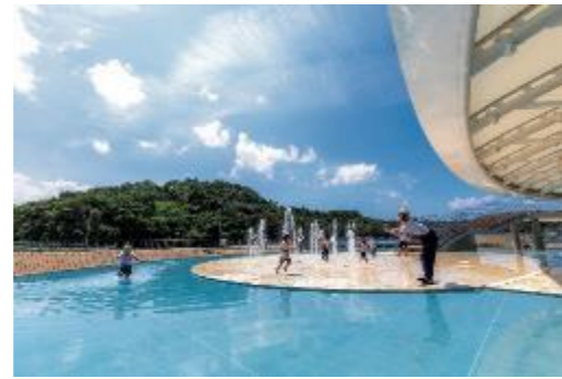
⑪水あそび場 (道の駅 ぎのざ)