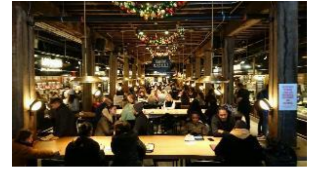
⑬外国のおしゃれなフードコート (NY 等)