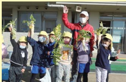
【大きな大根が獲れて大喜びの園児たち】

「おもたかった」、「おいしそうだな根がとれた」など、おおはしゃぎでした。園長先生は、「みんなで大切に育てました。子どもたちは、大根栽培を通して、土