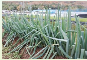
【試験栽培の姫路ネギ（白ネギ）】

昨年からは、姫路ネギ（白ネギ）の栽培も試験的に始めました。令和3年11月30日に認定農業者となり、作付面積も徐々に増やしていく予定です。「今後の目標は、雇用ができるよう規模を拡大し、後継者も育てていきたいです」と意欲を語っておられました。