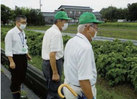
【農地パトロールの様子】

今年度は、8月18日〜20日に6班集体で、平成30年度〜令和2年度の新規就農者の農地(計151筆)を対象に農地パトロールを実施しました。耕作されていない一部の農地につきましては、適正に管理するよう指導しました。