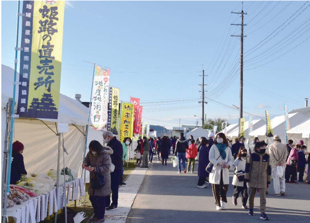
ひめじ地産地消フェア（姫路市農業振興センターにて）