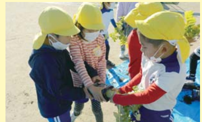
【ペットボトルから大根を抜く園児たち】

9月中旬にひとりひとりのペットボトルに大根の種を蒔きました。ペットボトルを使用すると、大根が大きくなったときに、土の部分が少なく、雑草が生えにくくなります。種まきのあとの世話も、園児たちの仕事です。無農薬で育てるため虫がつきやすく、ついた虫を駆除することや、水やりの大切さなどを伝えながら、先生方や園児たちと一緒に大根の成長を見守りました。