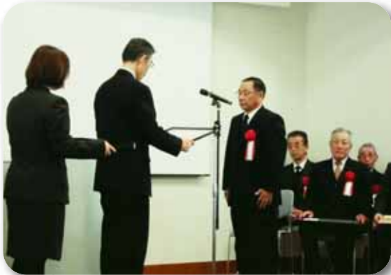
優良集落営農組織表彰～(株)アグリ香寺

〒670-8501 姫路市安田四丁目1番地 TEL.079-221-2822 FAX.079-221-2809