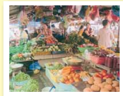
(参考:ベトナムの平均賃金 約2～3万円/月)