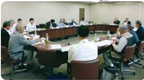
【10/27開催 農業振興部会】