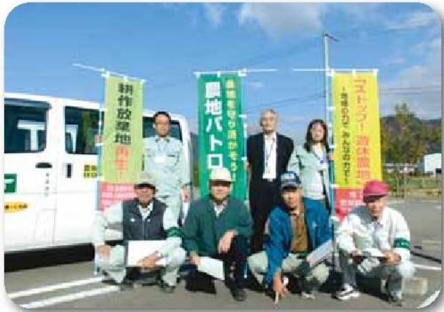
農地パトロール出発式

〒670-8501 姫路市安田四丁目1番地 TEL.079-221-2822 FAX.079-221-2809