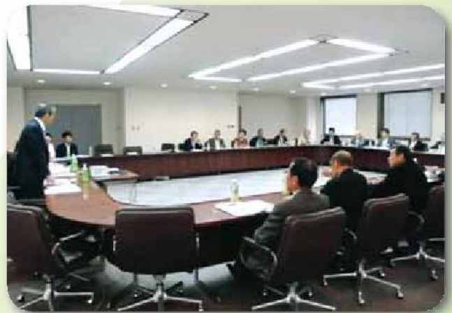
香美町農業委員会来訪