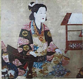
茨城県常総市 弘経寺蔵