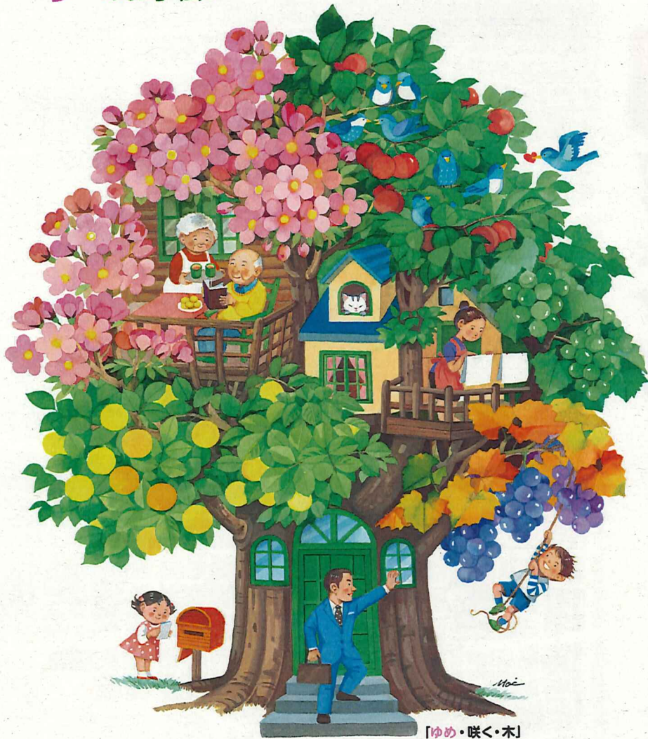
「ゆめ・咲く・木」 (Yume・Saku・Ki)