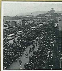
昭和31年の姫路お城まつりの様子

姫路お城まつりは戦後間もない昭和23年、廃墟と化した姫路中心部にあって、奇跡に残った姫路城を戦後復興のシンボルとし、新生姫路市の誕生を祝し、市民の心のよりどころとなる祭りとして幕を開けました。