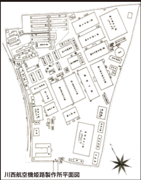
川西航空機姫路製作所平面図