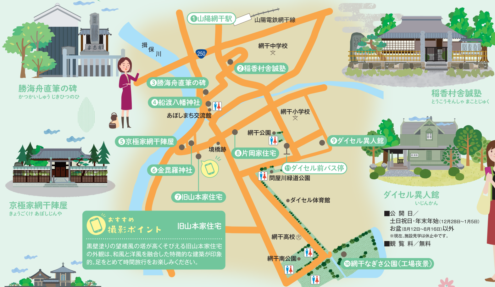
勝海舟直筆の碑 かつかいしゅうじきひつのみ

様々な歴史の記憶をめぐる網干の港街。多くの古く珍しい建築物は散策に色を添えます。街歩きのクライマックスには工場夜景を。