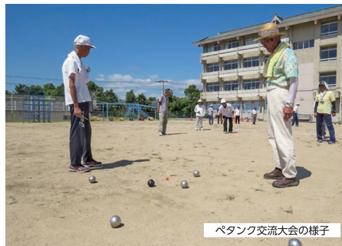
ペタンク交流大会の様子