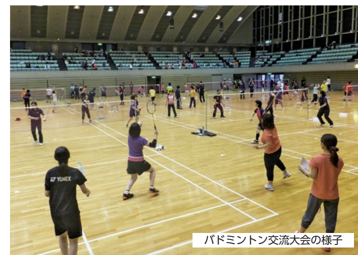
バドミントン交流大会の様子

スポーツクラブ21ってどこかで見たり聞いたりしたことがありませんか？ スポーツクラブ21は、「誰もが、いつでも、身近なところで」スポーツができることを目指した地域スポーツクラブです。小学校の体育館や運動場など、身近な場所ですさまざまなスポーツを行っています。皆さんもスポーツクラブ21と一緒にスポーツを楽しみましょう！