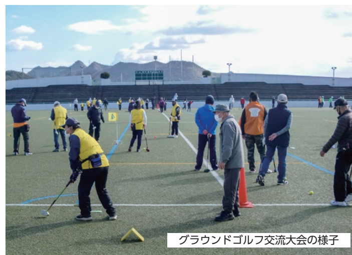
グラウンドゴルフ交流大会の様子