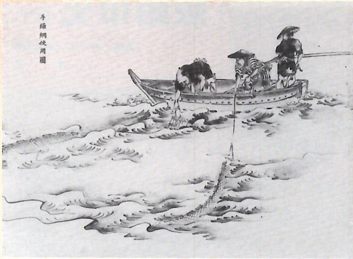
手繰網使用図 (漁具図解)

それでもなお播州の雄としての貫禄は充分にあつたといえよう。残された史料は、戦災で消失した旧市内を除いて、きわめて豊富であり、史料を大切に保存し、あるいはたんねんに記録して後世に伝えんとする先人の気魄が感じられる。