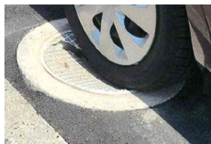
公共ます蓋のひび割れ

マンホール蓋・公共ます蓋の点検については、下水道を管理する市職員・委託業者が定期的に点検、パトロールを実施しており、不具合を発見すれば、緊急で取替え、補修等の対応をしております。