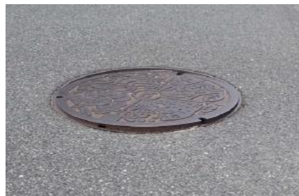
マンホール蓋のがたつき