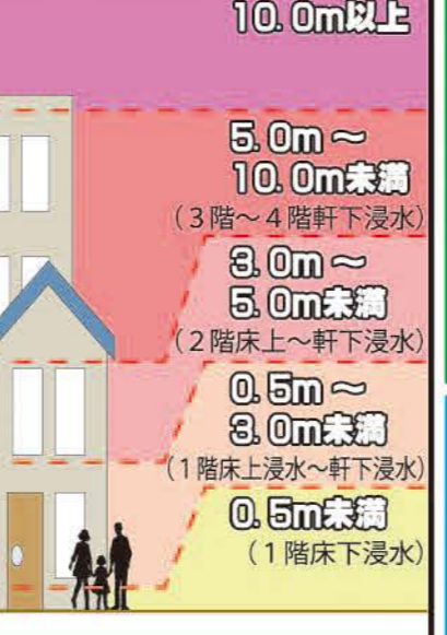
洪水浸水深想定範囲