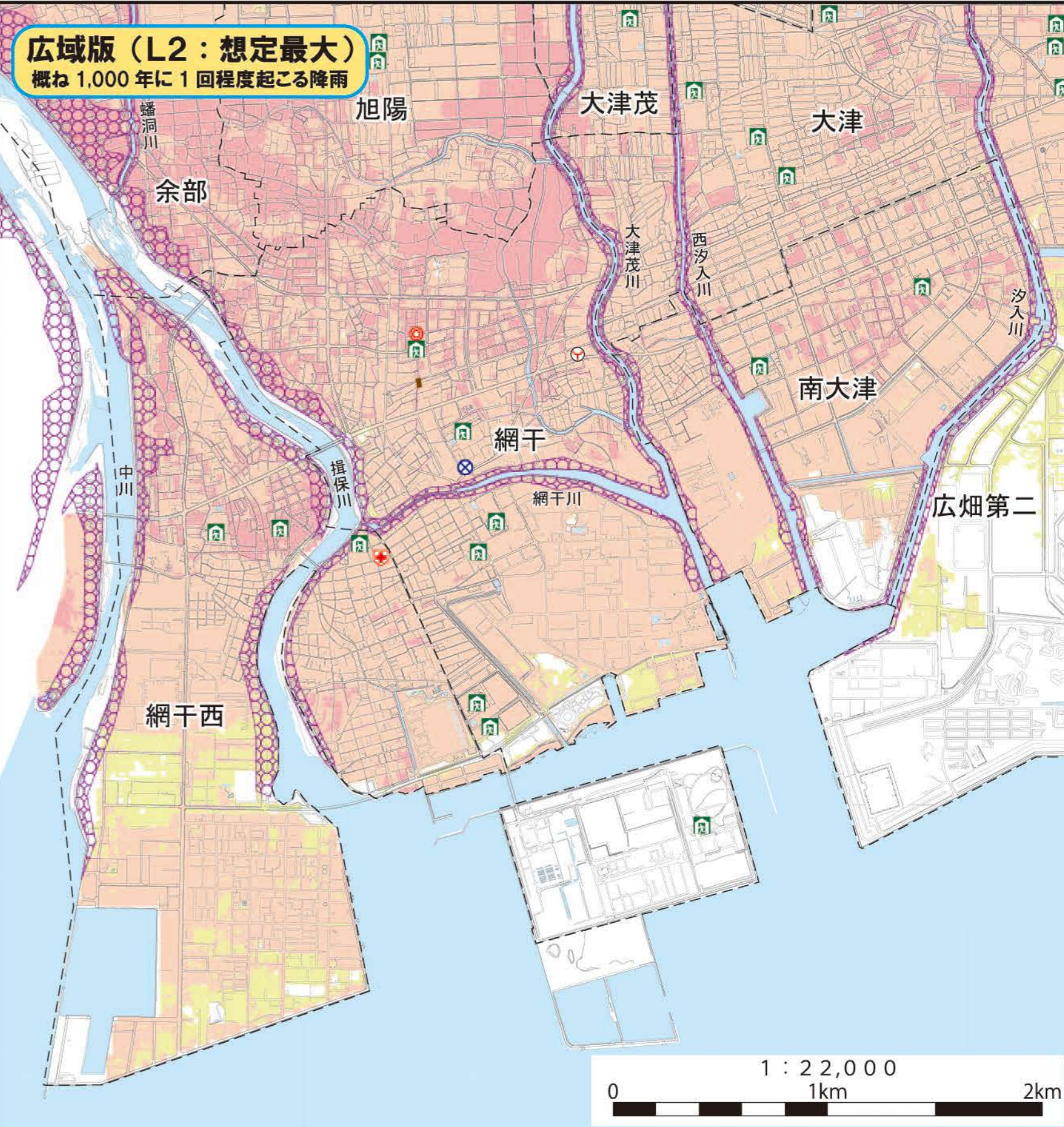
1 : 22,000 0 1km 2km