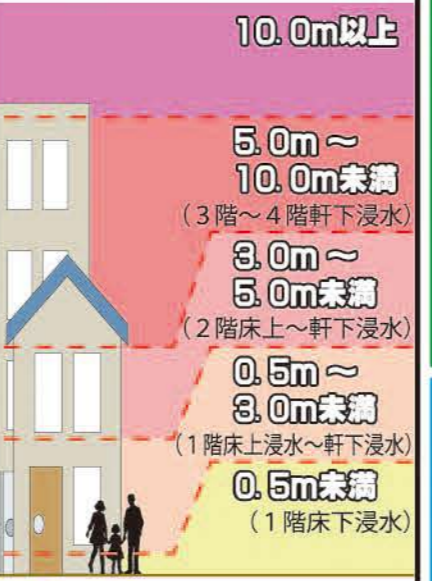
洪水浸水深想定範囲