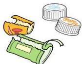
ラベル・キャップ