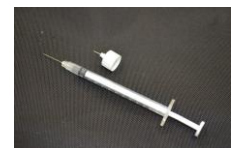
実際に混入していた注射器