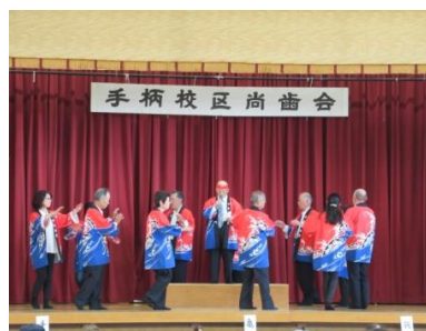
播州音頭「善助音頭」