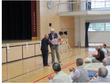
百歳花束贈呈(代理)