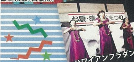
ハワイアンフラダンス