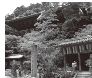
書写山円教寺(摩尼殿)

付近には、応永29年(1422年)、赤松満祐が築城し、嘉吉の乱の際に陣をとった坂本城跡があります。また、花山法皇や後醍醐天皇が書写山行幸の際、車を停めた屋敷「御車寄跡」があります。