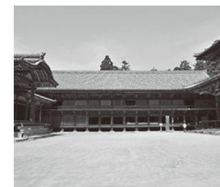
書写山円教寺(常行堂、大講堂、食堂)