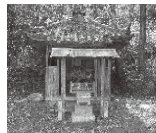
苔の清水・苔の地蔵：山崎に湧く清水は苔の清水と呼ばれ、播磨十水の一つといわれました。お堂には3体の石仏があります。