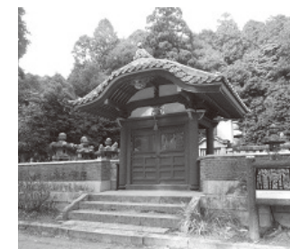
榊原忠次墓所の唐門