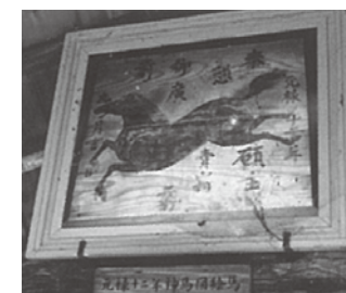
「お陰参り図」絵馬:稲岡神社には江戸時代に流行った伊勢神宮への集団参詣「お陰参り」を描いた絵馬が奉納されています。