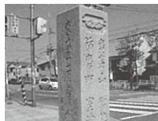
市之橋道標:大正時代に建てられた道標で、高砂や室津などへの道を示しています。