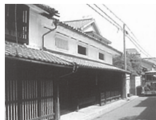
森家住宅(非公開):明治19年に建てられた建物。改造が少なく当時の町屋の様子をよくとどめています。