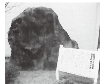
切手・木綿会所跡