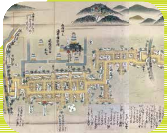
▲山口県文書館 宝暦末期(1760頃)