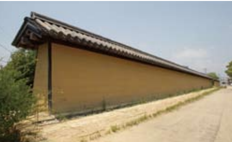
[上]文政11年(1828)に姫路藩が天川に架けた総竜山石製の天川橋。今は御着城跡に移設保存されています。 [下]播磨国分寺跡