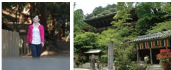
▲書写山円教寺(摩尼殿)

一条天皇の中宮彰子に仕えていた和泉式部は、彰子やほかの女房とともに性空上人を訪ねましたが、会ってもらえませんでした。そこで、寺の柱に和歌を書いて立ち去ろうとしたところ、歌に感心した上人が呼び戻して丁寧に教を垂れたという伝説があります。