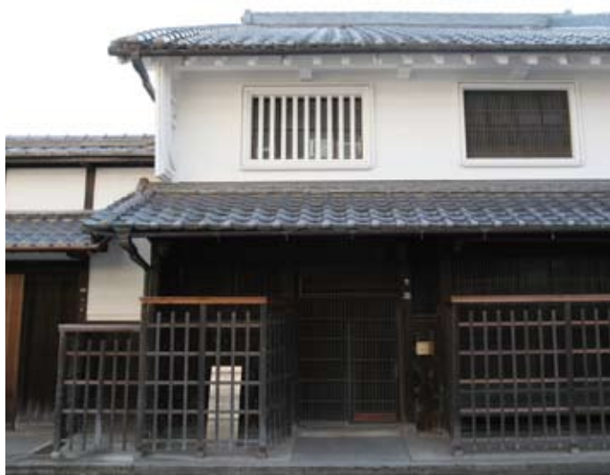
初井家住宅 (非公開) ▶