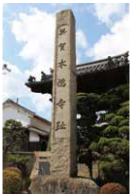
英賀本徳寺跡(明蓮寺)▶

英賀城は嘉吉元年(1441)、三木通近が入城して以降、三木氏10代にわたる140年間、播磨地方における経済・文化・宗教の中心地となり、寺内町を構成して栄華を極めました。歴代城主は英賀神社を領内の総氏神としてあがめるとともに、明応2年(1493)には一族で浄土真宗に帰依。英賀本徳寺(英賀御坊)をはじめ多くの真宗寺院が建てられました。天正8年(1580)の羽柴(豊臣)秀吉の攻略により、英賀城は落城。城下町も火の海に包まれたと伝えられています。その後、本徳寺は亀山に移されました。