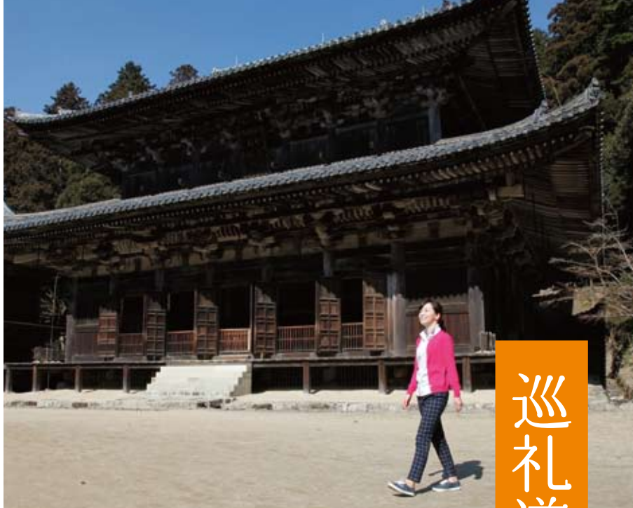
▲書写山円教寺(大講堂)

貞観17年(875)、随願寺に勅使として訪れていた在原業平は、滞在中に有明峯(増位山の東の峯)で歌を詠んだと伝えられます。「糸の細道」は、砥堀から有明山までの道を指していると考えられています。