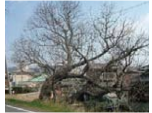
▲今も市川沿いに残るはぜの木

文化年間(1804年~1818年)、姫路藩の財政窮乏は深刻になり、藩主・酒井忠道は河合寸翁(道臣)に藩政改革の一切を委任しました。河合寸翁は木綿の専売制などで藩の財政を立て直しますが、その改革の一環として、文化8年(1811)に西光寺野台地で朝鮮人参の栽培を始め、人参役所が設けられました。また、天保元年(1830)には、藩製口ウソクを作るため市川沿いにはぜの木を植えたといわれ、その名残の木が現在も残っています。