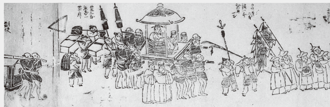
琉球使節行列図 たつの市教育委員会蔵 (江戸時代)

琉球(現在の沖縄県)は、江戸時代までは独立した国家で独自の文化を育んでいました。慶長14年(1609年)の薩摩の侵攻により幕藩体制に組み込まれると、王国を存続するための儀礼の一つとして琉球使節の江戸参府(江戸上り)が行われました。琉球使節は100人ほどで構成され、寛永11年(1634年)から嘉永3年(1850年)の間に18回渡来しました。瀬戸内海の要港である室津にも立ち寄りしました。