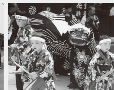
市川町:甘地獅子舞い