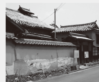
福崎町:辻川界隈と大庄屋「三木家」 (保存修理工事中)

銀の馬車道が通る姫路市、福崎町、市川町、神河町、朝来市と兵庫県といった行政、商工会議所などの各種団体、旅行社・交通事業者などの企業、学識者などが銀の馬車道ネットワーク協議会を結成し、銀の馬車道プロジェクトを展開しています。ラッピング列車、バスの運行、銀の馬車道関連商品の開発をはじめ、「銀の馬車道劇団」による公演活動などさまざまな取り組みを進めています。