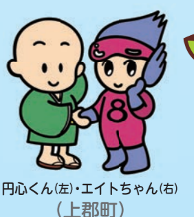
円心くん(左)・エイトちゃん(右) (上郡町)