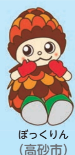
ほっくりん (高砂市)