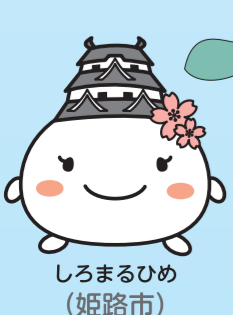
しろまるひめ (姫路市)