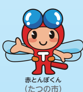
赤とんぼくん (たつの市)