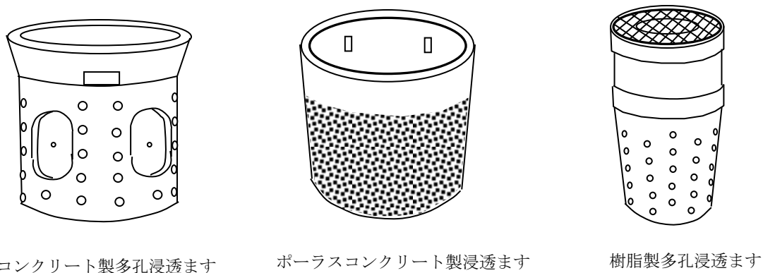
(図1) 浸透ますの種類 (例)

ウ 底部ごみ除去フィルターは、浸透ますの底部の目詰まり等を防止する装置で、金網、ポラスコンクリート製等のものがある。