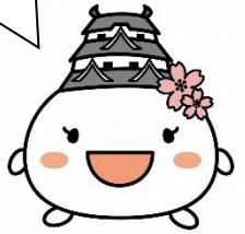
姫路市イメージキャラクター しろまるひめ

お城に向かって歩いてね。 全部で 12 個のデザインマン ホール蓋（城）があるよ。 何個見つかるかな？