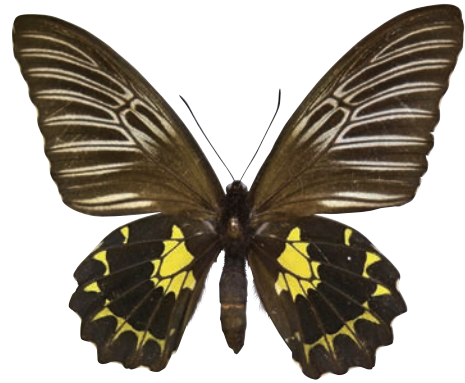
25-b Troides prattorum (Joicey & Talbot,1922) ブルキシタアゲハ