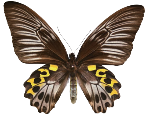
1 - d Troides hypolitus cellularis Rothschild,1895 サビモンキシタアゲハ・セレベス島亜種