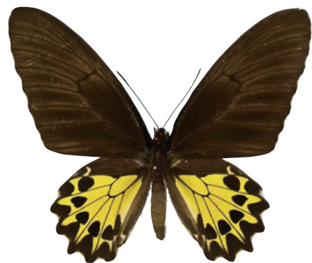
20-f Troides helena propinquus Rothschild,1895 ヘレナキシタアゲハ・スンバワ島亜種