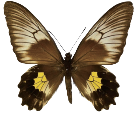
12-b Troides plato (Wallace,1865) チモールキシタアゲハ