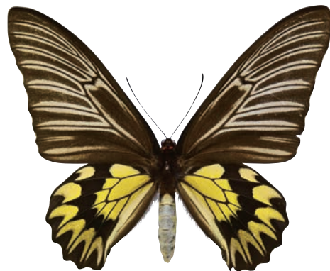
25-d Troides magellanus (Felder,1862) コートーキシタアゲハ