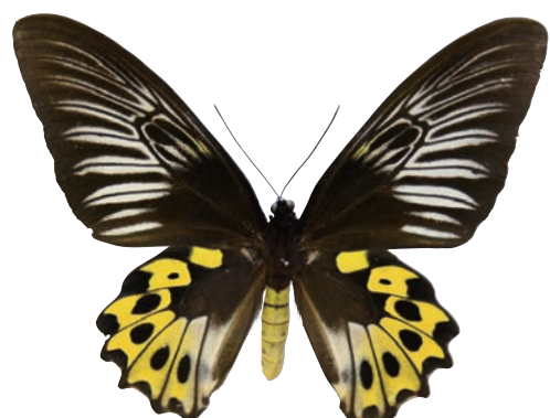
1 - f Troides hypolitus sulaensis (Staudinger,1895) サビモンキシタアゲハ・スラ諸島亜種