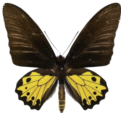
19-e Troides helena nereides Fruhstorfer,1906 ヘレナキシタアゲハ・バウエアン島亜種