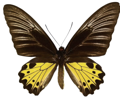
17-d Troides helena typhaon Rothschild,1908 ヘレナキシタアゲハ・スマトラ島北東部亜種