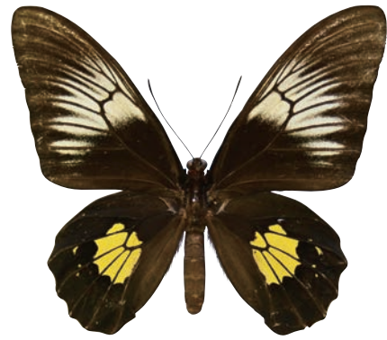
11-d Troides criton critonides (Fruhstorfer, 1903) クリトンキシタアゲハ・オビ島亜種