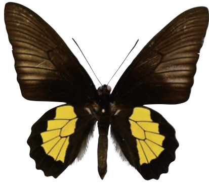
12-a Troides plato (Wallace,1865) チモールキシタアゲハ