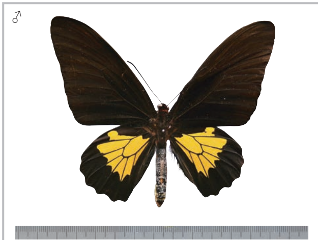
24-a Troides oblongomaculatus bandensis Pagenstecher,1904 パプアキシタアゲハ・バンダ諸島亜種