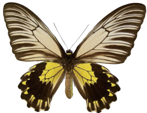
6 - f Troides amphrysus flavicollis (Druce,1873) アンフリサスキシタアゲハ・ボルネオ島北部亜種