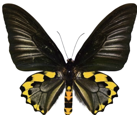
1 - e Troides hypolitus sulaensis (Staudinger,1895) サビモンキシタアゲハ・スラ諸島亜種