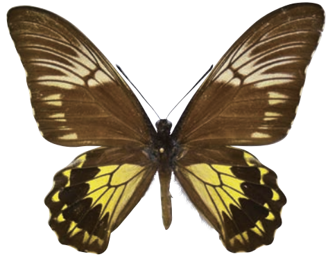
7 - b Troides cuneifera cuneifera (Oberthür, 1879) クサビモンキシタアゲハ・名義タイプ亜種