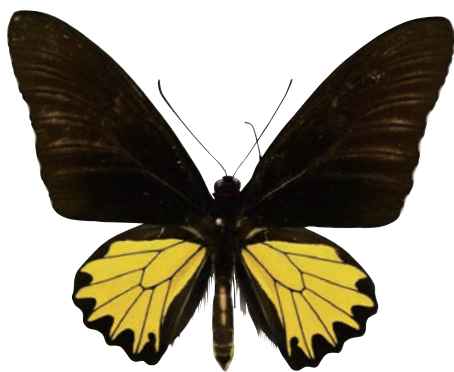
17-e Troides helena dempoensis Deslisle,1993 ヘレナキシタアゲハ・スマトラ島南部亜種