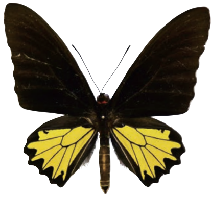
20-a Troides helena antileuca Rothschild,1908 ヘレナキシタアゲハ・カンゲアン諸島亜種