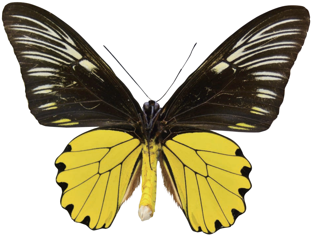
表紙(表) アンフリサスキシタアゲハ・タンベラン諸島亜種 雄(背面) ホロタイプ Troides amphrysus perintis Kobayashi, 1986 ♂ Holotype 表紙(裏) 同 (腹面)