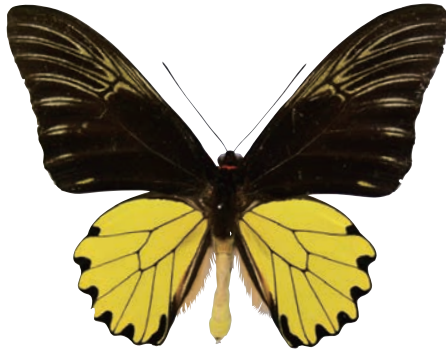
3-a Troides amphrysus astrea Hayami,1992 アンフリサスキシタアゲハ・バニヤック諸島亜種