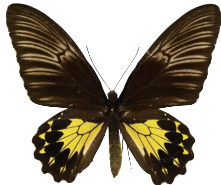
17-f Troides helena dempoensis Deslisle,1993 ヘレナキシタアゲハ・スマトラ島南部亜種