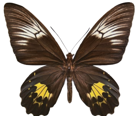
11-f Troides riedeli (Kirsch, 1885) タニンバルキシタアゲハ