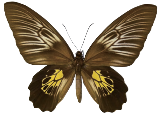
12-d Troides haliphron haliphron (Boisduval,1836) ハリフロンキシタアゲハ・名義タイプ亜種