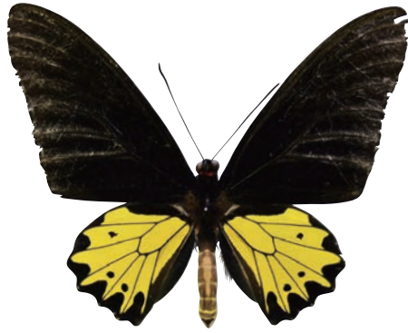
17-a Troides helena heliconoides (Moore,1877) ヘレナキシタアゲハ・アンダマン諸島亜種