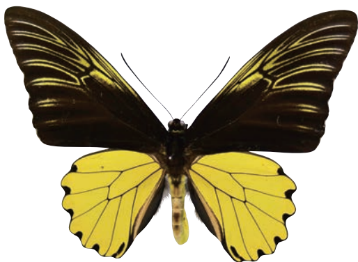
6 - e Troides amphrysus flavicollis (Druce,1873) アンフリサスキシタアゲハ・ボルネオ島北部亜種