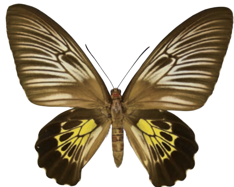
12-f Troides haliphron pallens (Oberthür,1879) ハリフロンキシタアゲハ・サラヤル島亜種