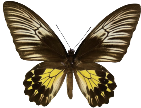
19-d Troides helena rayae Deslisle,1991 ヘレナキシタアゲハ・ビリトン島亜種