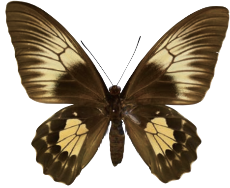
11-b Troides criton criton (Felder, 1860) クリトンキシタアゲハ・名義タイプ亜種