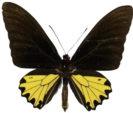
20-c Troides helena sagittatus (Fruhstorfer,1896) ヘレナキシタアゲハ・ロンボク島亜種