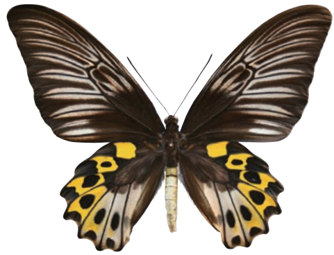
1 - b Troides hypolitus hypolitus (Cramer,1775) サビモンキシタアゲハ・名義タイプ亜種