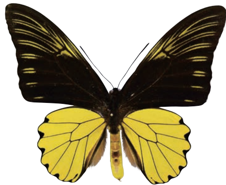
6 - c Troides amphrysus hilbert Hayami,1992 アンフリサスキシタアゲハ・カリマタ島亜種