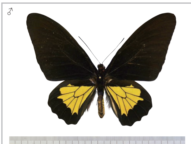
24-e Troides oblongomaculatus papuensis (Wallace,1865) パプアキシタアゲハ・ニューギニア島亜種