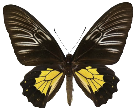
25-f Troides rhadamantus rhadamantus (Lucas,1835) フィリピンキシタアゲハ・名義タイプ亜種