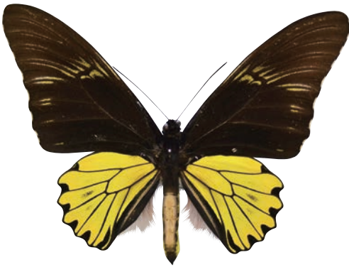
7 - c Troides cuneifera sumatrana (Hagen, 1894) クサビモンキシタアゲハ・スマトラ島亜種