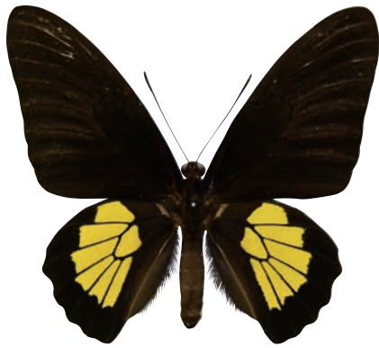
11-c Troides criton critonides (Fruhstorfer, 1903) クリトンキシタアゲハ・オビ島亜種