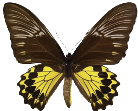
7 - f Troides cuneifera paeninsulae (Pendlebury, 1936) クサビモンキシタアゲハ・マレー半島亜種