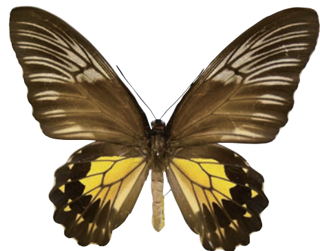
3-f Troides amphrysus vistara (Fruhstorfer,1906) アンフリサスキシタアゲハ・バツ島亜種