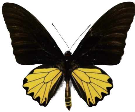
17-c Troides helena typhaon Rothschild,1908 ヘレナキシタアゲハ・スマトラ島北東部亜種