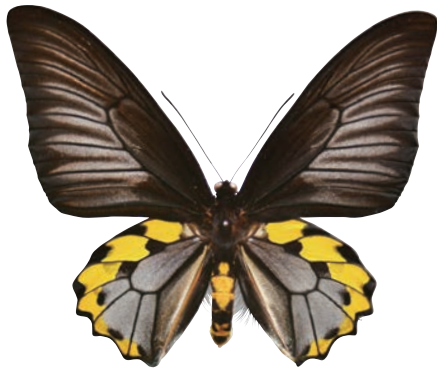
1 - c Troides hypolitus cellularis Rothschild,1895 サビモンキシタアゲハ・セレベス島亜種