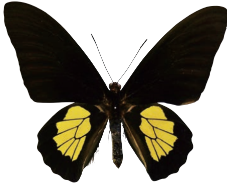
11-a Troides criton criton (Felder, 1860) クリトンキシタアゲハ・名義タイプ亜種