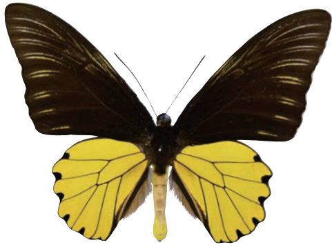
6 - a Troides amphrysus actinotia (Jordan,1909) アンフリサスキシタアゲハ・ボルネオ島南部亜種