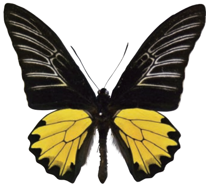
25-a Troides prattorum (Joicey & Talbot,1922) ブルキシタアゲハ