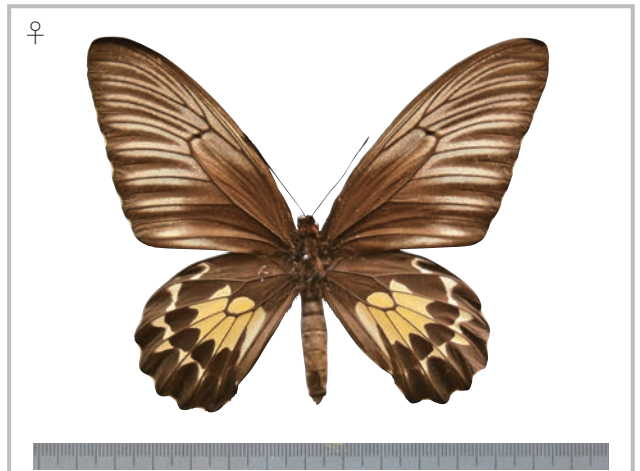
24-b Troides oblongomaculatus bandensis Pagenstecher,1904 パプアキシタアゲハ・バンダ諸島亜種