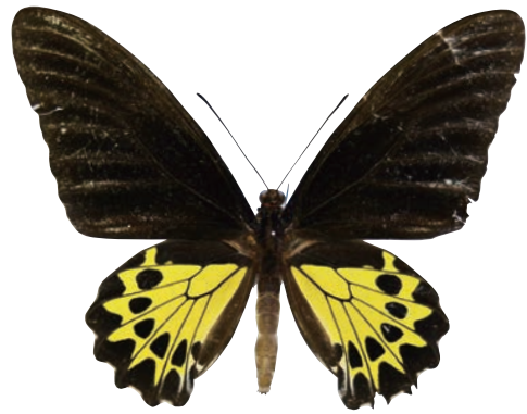
17-b Troides helena heliconoides (Moore,1877) ヘレナキシタアゲハ・アンダマン諸島亜種