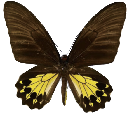
20-b Troides helena antileuca Rothschild,1908 ヘレナキシタアゲハ・カンゲアン諸島亜種