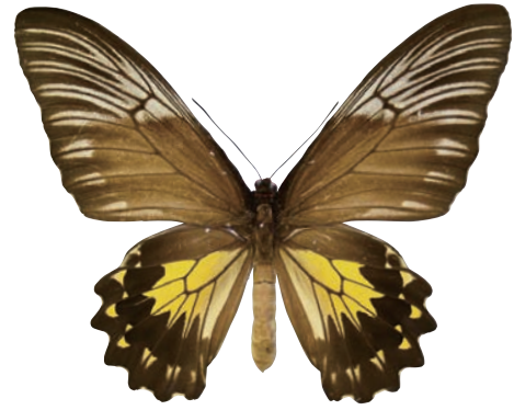
3-b Troides amphrysus astrea Hayami,1992 アンフリサスキシタアゲハ・バニヤック諸島亜種