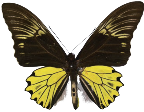
7 - a Troides cuneifera cuneifera (Oberthür, 1879) クサビモンキシタアゲハ・名義タイプ亜種