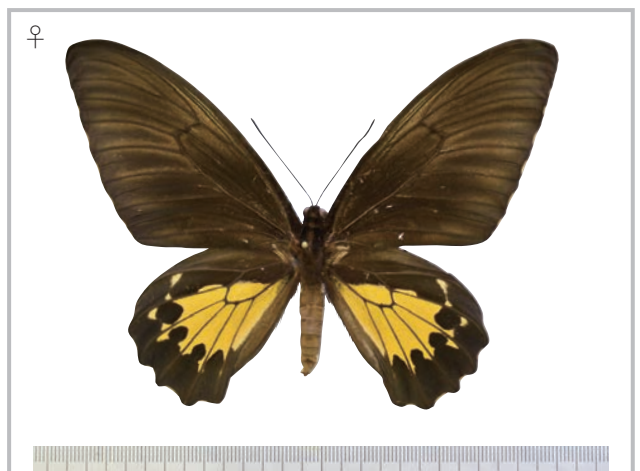
24-f Troides oblongomaculatus papuensis (Wallace,1865) パプアキシタアゲハ・ニューギニア島亜種