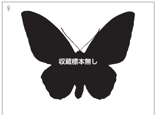
24-d Troides oblongomaculatus hanno Fruhstorfer,1904 パプアキシタアゲハ・ゴラム島亜種