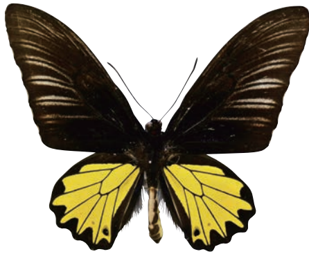
19-a Troides helena nereis (Doherty,1891) ヘレナキシタアゲハ・エンガノ島亜種