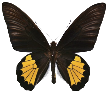
11-e Troides riedeli (Kirsch, 1885) タニンバルキシタアゲハ