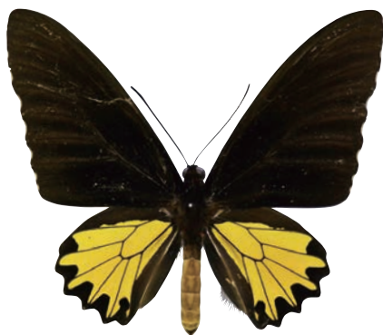
20-e Troides helena propinquus Rothschild,1895 ヘレナキシタアゲハ・スンバワ島亜種