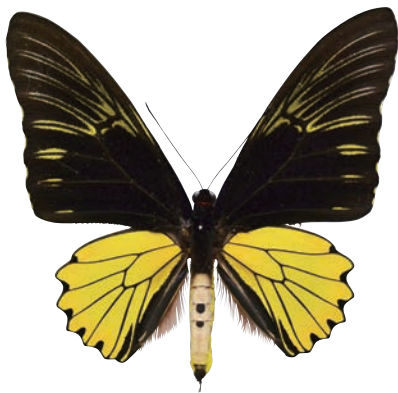
7 - e Troides cuneifera paeninsulae (Pendlebury, 1936) クサビモンキシタアゲハ・マレー半島亜種