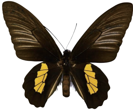
12-c Troides haliphron haliphron (Boisduval,1836) ハリフロンキシタアゲハ・名義タイプ亜種