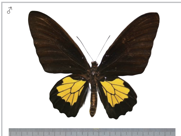
24-c Troides oblongomaculatus hanno Fruhstorfer,1904 パプアキシタアゲハ・ゴラム島亜種