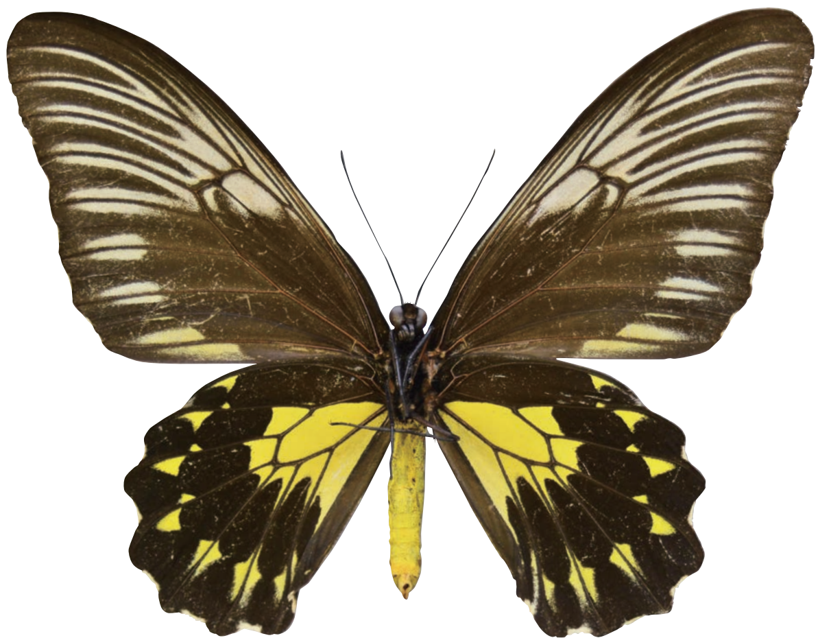
裏表紙 (表) アンフリサスキシタアゲハ・タンベラン諸島亜種 雌 (背面) アロタイプ Troides amphrysus perintis Kobayashi, 1986 ♀ Allotype 裏表紙 (裏) 同 (腹面)