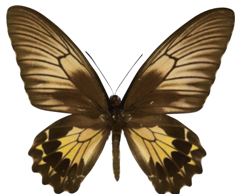
19-f Troides helena nereides Fruhstorfer,1906 ヘレナキシタアゲハ・バウエアン島亜種