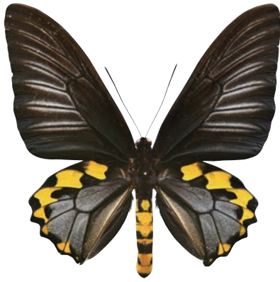
1 - a Troides hypolitus hypolitus (Cramer,1775) サビモンキシタアゲハ・名義タイプ亜種