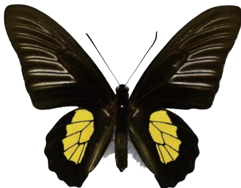
12-e Troides haliphron pallens (Oberthür,1879) ハリフロンキシタアゲハ・サラヤル島亜種