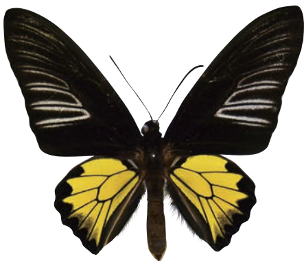
25-e Troides rhadamantus rhadamantus (Lucas,1835) フィリピンキシタアゲハ・名義タイプ亜種