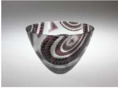
(1) 青野武市 (招待作家) 《茄子紺被蛇の目文鉢》