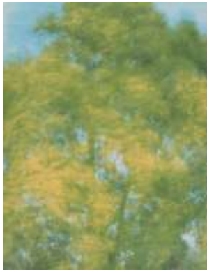
(4) 秋岡美帆 《そよぎ》