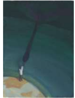
(3) 松井紫朗 《手に取る宇宙 イメージ・ドロージング》