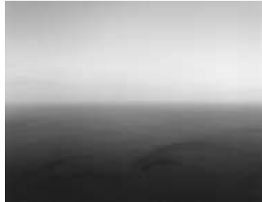
(2) 杉本博司 《日本海、隠岐》