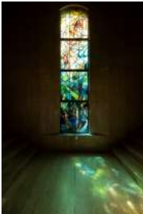
(7) 立花江津子 《芸術の曙》