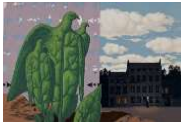
(5) ルネ・マグリット 《あの大きな鳥たちは宝島の鳥だ…》